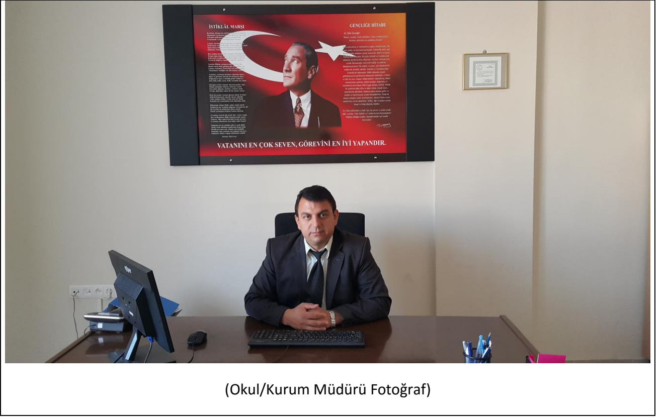
(Okul/Kurum Müdürü Fotoğraf)